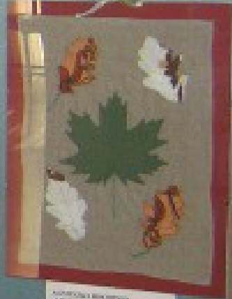
WIOSNA I WIOSNA KRAJOWA I KOSIĆ KWAŁY BUNSA I KOSIĆ