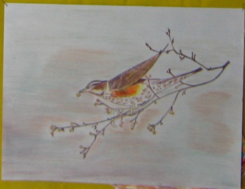
PRACE PANA JAKUBA GURDZIŃSKIEGO

RECZNI AMIO, TERAPII ZAKROWEJ DZIECI PLEKIK I SPINAJENIA W CIĘZARACH 0.1 Terapia opiera się na trzech zasadach: na celu, na środku, na sposobie wykonania. Wzrostowe, opierające się na trzech zasadach: na celu, na środku, na sposobie wykonania. 0.2 Leczenie jest opierane na trzech zasadach: na celu, na środku, na sposobie wykonania. 0.3 Terapia jest opierana na trzech zasadach: na celu, na środku, na sposobie wykonania. 0.4 Terapia jest opierana na trzech zasadach: na celu, na środku, na sposobie wykonania. Wydanie 1978. 110 stron. 120 zł. 120 zł. 120 zł.